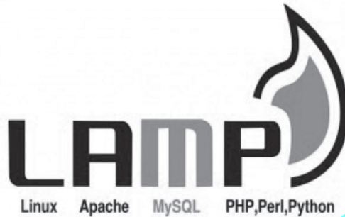
Figura 3. Aplicaciones de servidor LAMP