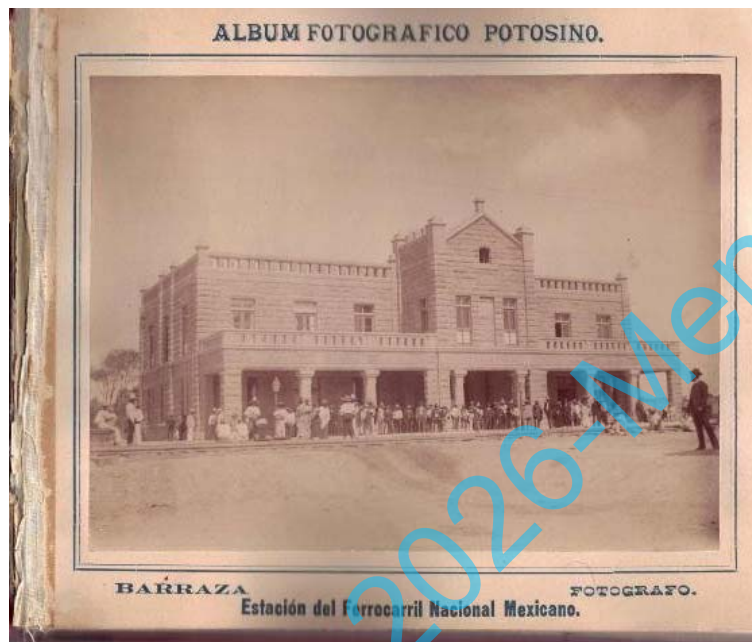
A. Barraza “Álbum fotográfico potosino” Col. Centro de Documentación Histórica, de la Universidad Autónoma de San Luis Potosí.

El 15 de julio de 1890, “ El Estandarte ” anuncia la venta del “ Álbum Fotográfico Potosino ” 29 del notable fotógrafo de estudio y ganador de varios concursos a nivel nacional, Agustín Barraza, con imágenes captadas de calles, edificios, plazas y jardines de la capital potosina y el cual viene a ser el primer álbum de esa naturaleza en San Luis Potosí.