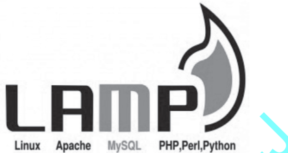
Figura 3. Aplicaciones de servidor LAMP